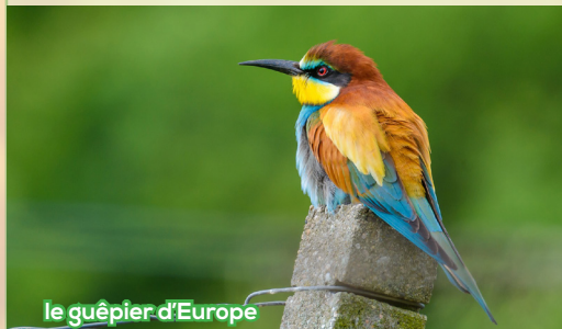
le guépier d'Europe